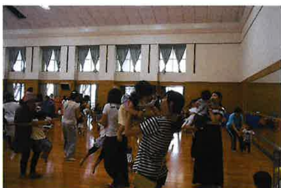
げんきっ子広場 (金岡)