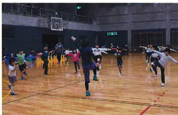
へキサスロン (初芝)