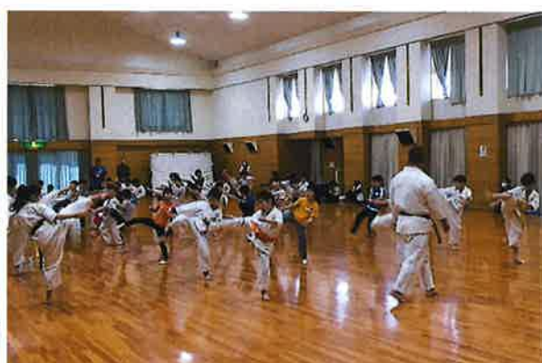
小学生スポーツ教室