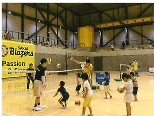
堺ジュニアスポーツ教室