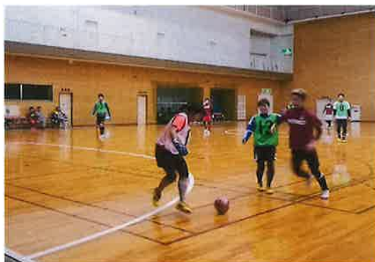
OHAMA CUP (大浜)