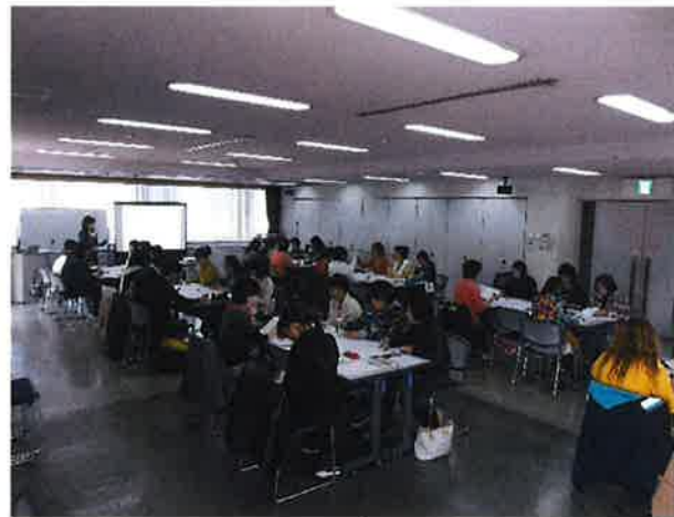
発達障害の理解と対応