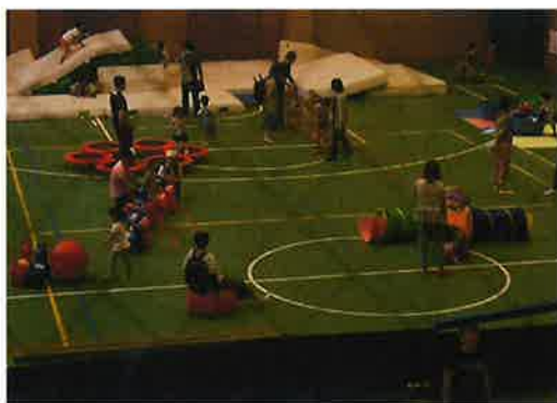
わんぱくひろば(大浜)