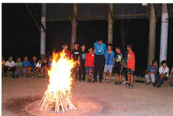
キャンプファイアー