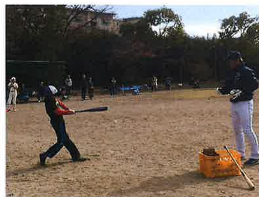
オリックス野球教室