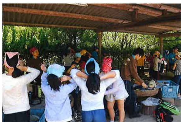
アウトドアクッキング