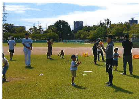
オリックス野球教室