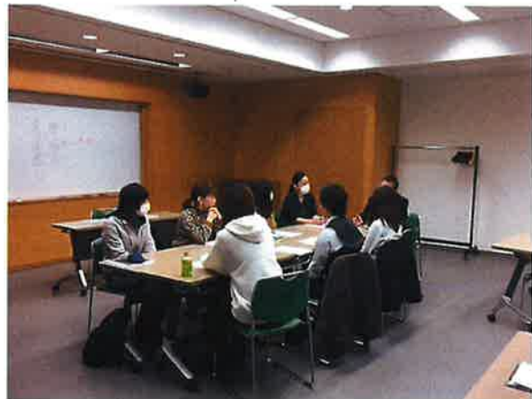
新任指導員研修会