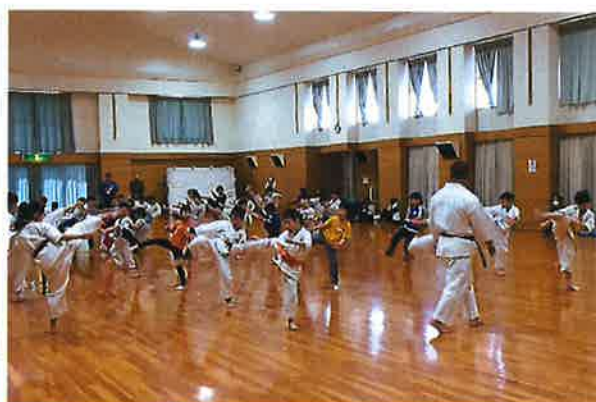
(卓球) 小学生スポーツ教室(昨年度) (空手)