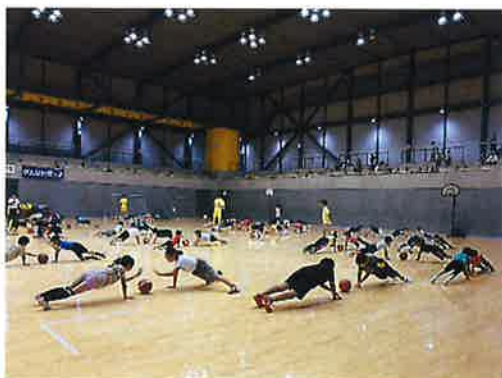
堺ジュニアスポーツ教室