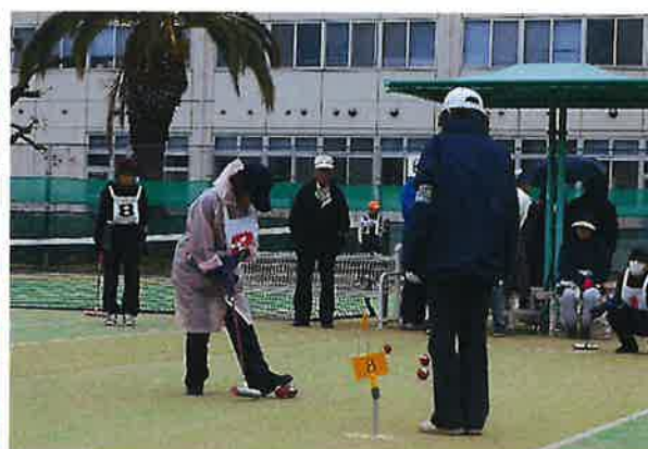
(バウンドテニス) 種目別大会(昨年度) (ゲートボール)