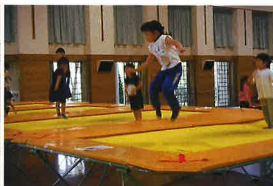
夏期トランポリン (金岡)