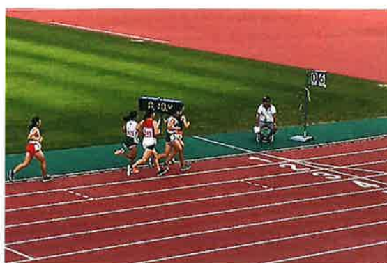
ディムライトゲーム (金岡)