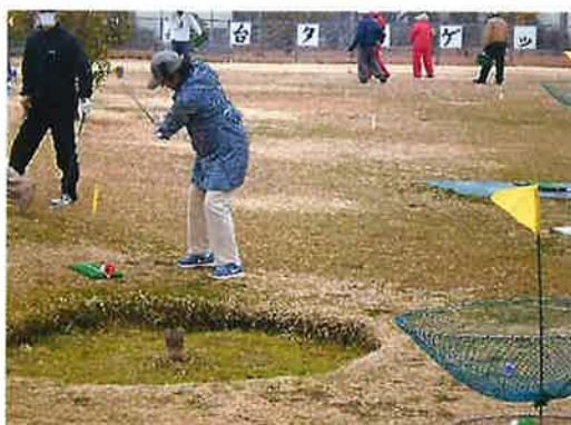
ターゲット・バードゴルフ