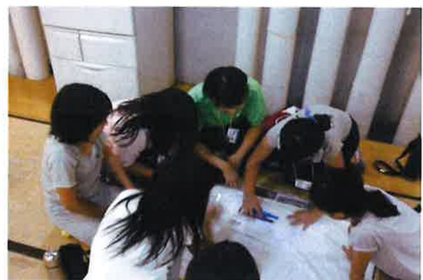
グループフラッグ作り