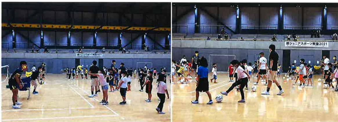
堺ジュニアスポーツ教室