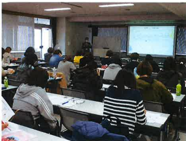
発達障害理解研修