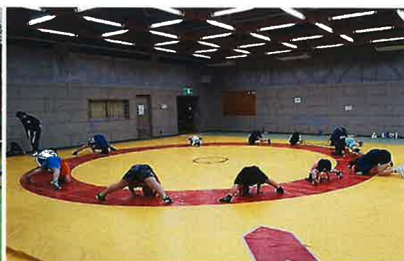
ジュニアレスリング (初芝)