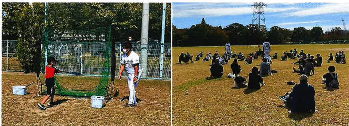
オリックス・バファローズ野球教室